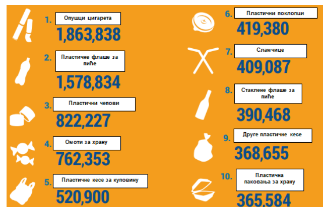
Slika 1 Prikaz vrste i količine sakupljenog okeanskog otpada u 50+ zemalja [2]

Plastika za jendokratnu upotrebu, koja se najčešće javlja u vidu ambalaže odnosno pakovanja ili pribora za hranu čini najveći problem plastičnog otpada zbog toga što se on baca nakon jedne upotrebe kao i zato što dobar deo nije moguće reciklirati ili iskoristiti na drugi način.