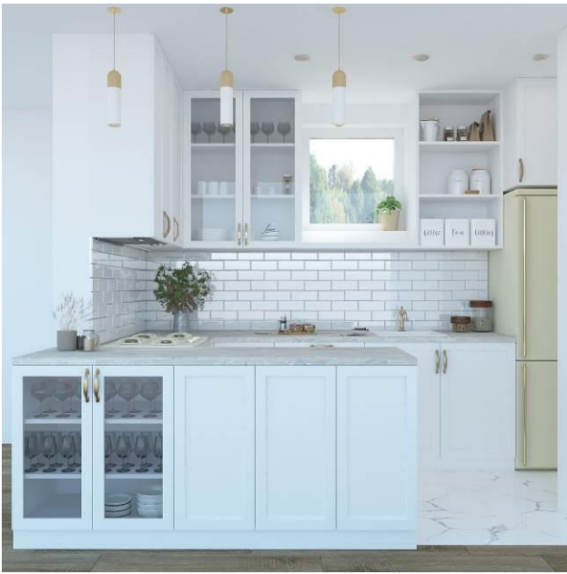
Slika 4. Vizualizacija stilske kuhinje