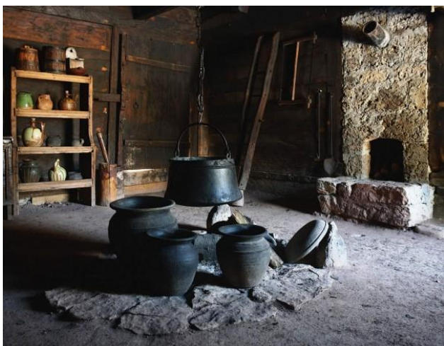
Slika 1. Ognjište

Gosti su se primali i sedeli okupljeni sa domaćinom oko ognjišta, tu su i posluživani. Na tom mestu su se sklappali dogovori, pričale su se legende, guslalo se i prenosila se tradicija sa kolena na koleno. Kraj ognjišta se davao i vraćao zajam. Mlada, kada bi napuštala svoj devojački dom, opraštajući se od porodice, ljubila bi i ognjište. Prilikom stupanja u nov, mladoženjin dom, opet bi poljubila prag i ognjište svoje buduće kuće [3].