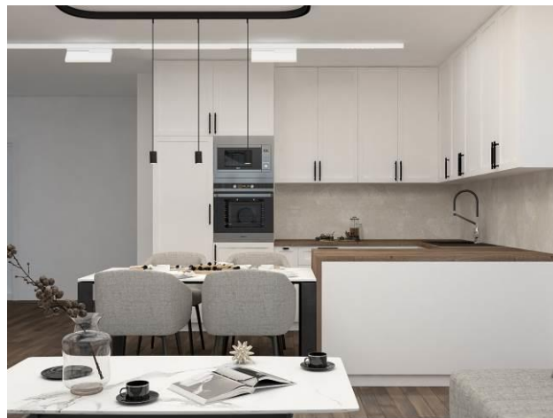
Slika 3.: Vizualizacija (render) kuhinjskog prostora

ostaju detalji koji će taj prostor učiniti životnim. Samim tim, svaki prostor dobija svoju atmosferu i svoj jedinstven i upečatljiv izgled. Kada projektant odradi rendere (primer: Slika 3.), šalje ih klijentu na odobrenje, ukoliko je potrebna neka izmena, menja sve dok klijent ne bude potpuno zadovoljan izgledom svoje kuhinje. Svaki projekat je poseban i jedinstven, a najveća nagrada je zadovoljstvo klijenta. Kada se sve to objedini, misija dizajnera je uspešno izvršena. Nakon prihvatanja projekta, renderi i radionički crteži se šalju firmama koje izrađuju kuhinje odnosno nameštaj po meri, zatim one daju ponudu i rok izrade. Montaža treba da bude ispraćena i od strane projektanta i od strane klijenta kako bi sve bilo izvedeno po projektu i kako ne bi došlo do grešaka.