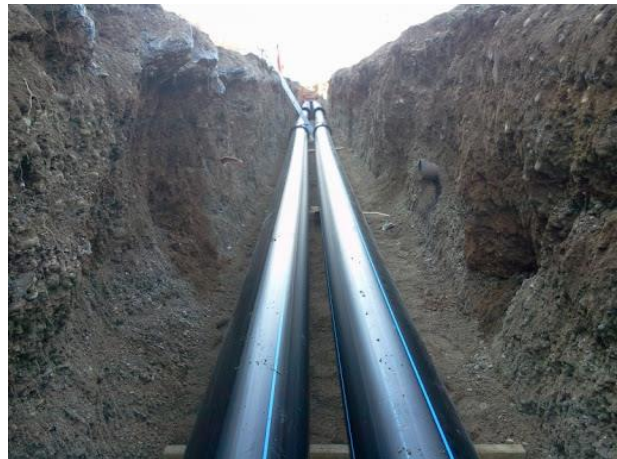
Slika 4. Polaganje HDPE cevi

takođe bolje trpe deformacije u pogledu širenja cevi u odnosu na čelik, pa samim tim amortizuju nadpritiske koji se javljaju kod hidrauličkog udara. Za određivanje prečnika cevovoda korišćena je jednačina kontinuiteta, a za određivanje potrebnog pritiska na ulazu se koristila Bernulijeva jednačina. Potreban pritisak na ulazu u pumpu se dobija tako što se saberu svi gubuci, u ovom slučaju lokalni i linijski, i na tu vrednost dodamo geodetsku razliku terena i potreban pritisak na izlazu. Na taj način se dobija potrebna visina dizanja koja u ovom slučaju iznosi 45,34m za centar pivot i 26,86m za rendžer.