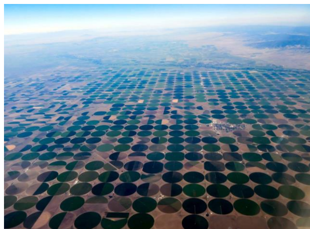
Slika 1. Centar pivot sistemi

Centar pivot sistem Sistem se sastoji od centralne piramide koja je sastavljena od čeličnih profila u obliku rešetke, kao i kišnih krila koje se koriste i kod Rendžera i Lineara. Kišna krila na sebi imaju ugrađene rasprskivače, čiji se radijus dejstva širi, pa tako kod centra rasprskivači imaju najmanji radijus, dok je na kraju mašine radijus dejstva najveći.