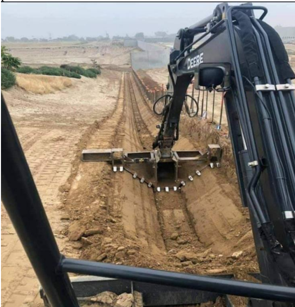
Slika 3. Kopanje kanala specijalno profilisanom kašikom

Jedan deo sekundarnog kanala III od stacionaže 3+701km pa do 4+964km će se iskoristiti kao deo kanala za Rendžer. Na istom kanalu se nalazi jedan armiranobetonski ramovski propust dimenzija 2x2 i dužine 15m na stacionaži 4+143km kao i dve tipske ustave na stacionaži 3+701km i 4+964km. Pored postojećeg kanala, za potrebe navodnjavanja se mora iskopati novi kanal ukupne dužine 574m koji se povezuje sa postojećim kanalom III pa ukupna dužina kanala za rendžer iznosi 1837m. Oba dela kanala, i novi i postojeći je potrebno obložiti vodonepropusnom folijom zbog velike infiltracije. Od ostalih objekata na kanalu, postoje još 17 tipskih propusta koji se nalaze na kanalima II i III i koji se moraju postaviti kako bi Rendžer neometano prolazio.