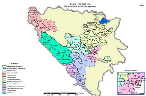
Slika 1. Kantoni u Federaciji Bosne i Hercegovine [4].

Republika Srpska je podijeljena na regije i dalje na općine, ali za razliku od kantona, regije su formalnog karaktera, bez administrativno-upravnih funkcija.