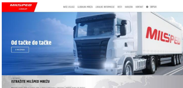
Slika 1. Izgled sajta kompanije Milšped [1]

Kompanija je važne informacije grupisala u okviru klasa: naše usluge, globalna mreža, lokalne informacije, vesti, karije i kontakt. Sajt je dostupan na engleskom i srpskom jeziku i kontinuirano se unapređuje.