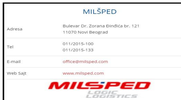
Slika 3. Promocija kompanije Milšped na sajtu [3]

kompanija želi da bude i deo tog virtuelnog okruženja. Preko specijalizovanih sajtova kompanija dopire do različitih ciljnih grupa svog poslovanja i obezbeđuje prisutnost u različitim sferama online sveta. Primer profila na ovom sajtu je prikazan na slici ispod.