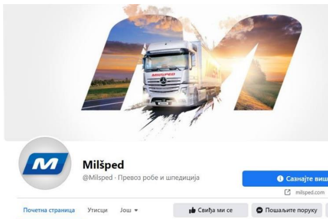
Slika 2. Kompanije Milšped na Facebook-u [2]

Sve važne informacije o poslovanju, klijentima, isporučiocima, kompanija objavljuje na svom profilu. Kompanija često ažurira informacije na ovoj društvenoj mreži.