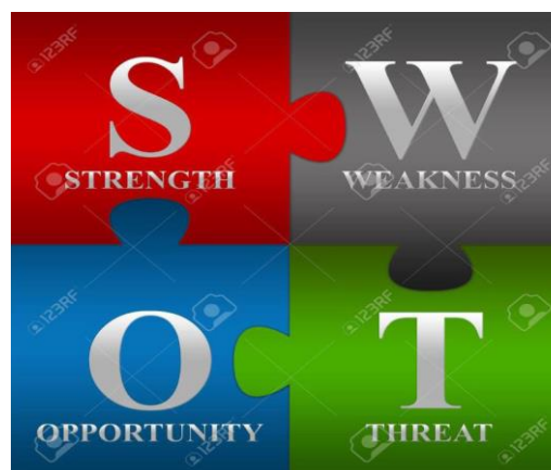
SLIKA 3 SWOT ANALIZA

SWOT analiza predstavlja analizu okruženja, i omogućava nam da sagledamo snage, slabosti, šanse i pretnje, kao i da se utvrde i analiziraju njihove međusobne povezanosti. SWOT predstavlja analizu pomoću koje se vrši interna analiza preduzeća (snage i slabosti), kao i eksterne faktore (šanse i pretnje) iz okruženja. (slika3):