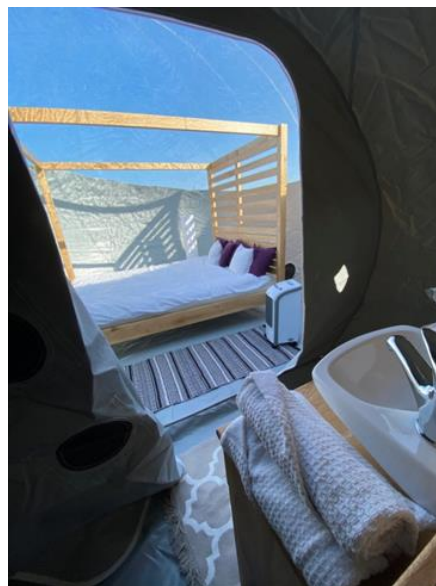
Slika 1. Unutrašnjost Bubble hotela

Umesto zavese biće postavljena trska u snopovima, kako bi sam izgled tuša bio bliži prirodi i kako ne bi narušavao izgled ambijentalne celine. To je poslednji deo koji je trenutno u fazi izrade. Prilikom izgradnje ovih hotela akcenat je usmeren na održivi razvoj i stoga su korišćeni prirodni materijali.