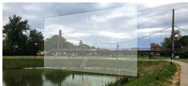
Слика 2. Мост на сувом и позиција источног огледала

Мост на сувом, као централни мотив пројекта, саграђен је 1962. године у виду viseћег моста од армирано бетонске конструкције [11]. Символ ироније чини Мост на сувом својствено јединственим, пример који се, као и у случају Кристијаније, опире потенцијалним политичким и инвеститорским интервенцијама. Мост је у пројекту урбане енклаве презервиран, око њега формирана је демаркација као врста заштитне опне са две стране. Слично Егзодусу, постављене су две монументалне паралелне површине оријентисане исток-запад, које оивичавају простор у правцу простирања насипа, то јест управно на сама језера. Висина површина надмашује висину моста како би се стекао утисак кутије. Те површине су у екстеријеру сачињене од апсолутно рефлектујућег материјала и представљају хипертрофирана огледала (Слика 2).