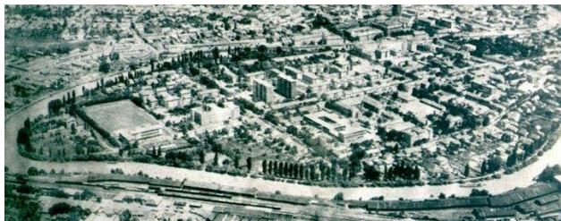
Слика 1. Мала Америка

изолованости и привада мирнијег, перифернијег начина живота чини простор јединственим. Порекло имена подручја није утврђено у потпуности, а најраније спомињање забележено је крајем 19. века као део града под називом „Америчко насеље“ или само „Америка“ [10]. Сматра се да, с обзиром на статус житеља, као и физичку одвојеност и окруженост водом, подручје поприма назив у колоквијалном говору Америка, а затим Мала Америка.