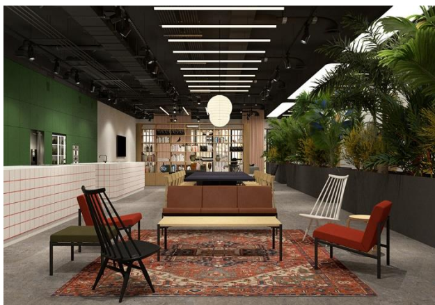
Slika 2. Vizualizacija zajedničke dnevne zone

Imajući u vidu relativno veliku cirkulaciju ljudi i visok intenzitet korišćenja prostora, neophodno je da materijali korišćeni u enterijeru budu kvalitetni, trajni, otporni na habanje, a da pritom ne budu zahtevni za održavanje.