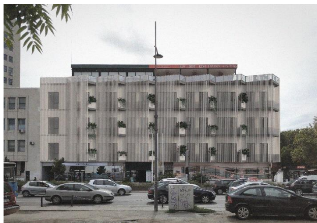
Slika 3. Predlog eksterijera objekta

To je postignuto korišćenjem brisoleja koji omogućavaju prolazak svetlosti i vazduha, a u isto vreme stvaraju iluziju monolitnog volumena. Drveni brisoleji pokrivaju gotovo čitavu površinu fasade, sa izuzetkom prekida na balkonima privatnih jedinica, gde se nalaze žardinjere sa biljkama. Prizemlje i poslednji sprat, koji ne pripadaju robnoj kući i koji nisu obuhvaćeni rekonstrukcijom, ostavljeni su u prvobitnom stanju.