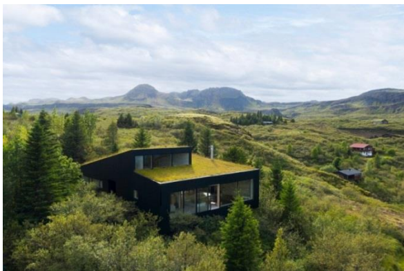
Slika 2: Primer - prikaz eksterijera – kuća za odmor - KRADS [2]