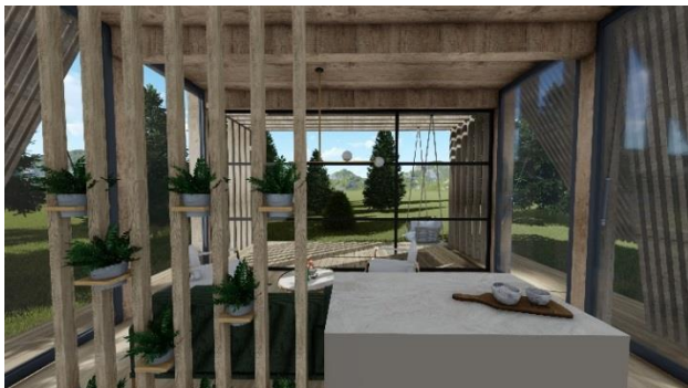
Slika 6: Prikaz enterijera montažne kuće