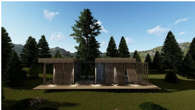
Slika 4: Prikaz eksterijera montažne kuće

Objekat je opremljen KNX tehnologijom „pametnih kuća“ koja omogućava integraciju svih sigurnosnih sistema, u jedinstven komunikacioni sistem.