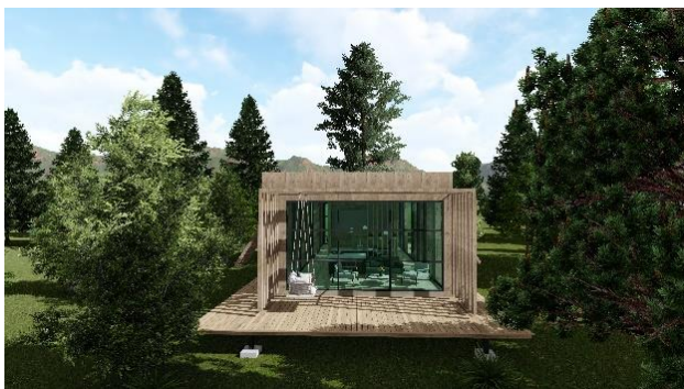
Slika 5: Prikaz eksterijera montažne kuće