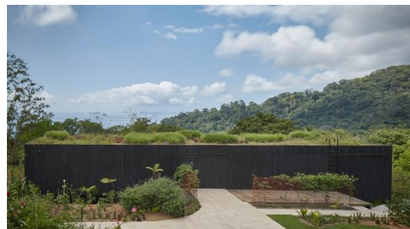
Slika 1: Primer - prikaz eksterijera - Atelier vilaa [1]

Svi primeri bave se suštinski sličnom temom kao i projektni zadatak. Glavni cilj jeste da daju što smislenije odgovore na kompleksne zahteve, kako bi omogućili sklad i jednostavnost funkcionisanja standardnih i nestandardnih programa, uvode i definišu nove sadržaje i naj-savremeniju opremu koja prostor, na prvom mestu čini humanim, pametnim, sigurnim, multifunkcionalnim i lako prilagodljivim za različite potrebe korisnika.