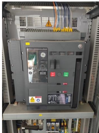
Slika 2. Spoljašnji izgled vazdušnog prekidača snage

sistema električne energije. Pored ovih zaštita se koristi dodatna zaštita koja se priključuje u poseban razvodni orman i koju čini vazdušni prekidač snage čija je naznačena struja 2500 A, dok je naznačena simetrična struja prekidanja 65 kA. On obuhvata zaštitu od preopterećenja, trenutnu prekostrujnu zaštitu, zemljospojnu zaštitu, termičku zaštitu. Izgled prekidača je prikazan na slici 2.