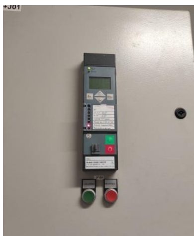
Slika 4. Spoljašnji izgled prekidačke/transformatorske ćelije

Spojni prekidač koji se nalazi u prekidačkom polju je opremljen relejom koji poseduje sve neophodne zaštite za bezbedan paralelan rad elektrane i njegov izgled je dat na slici 4.