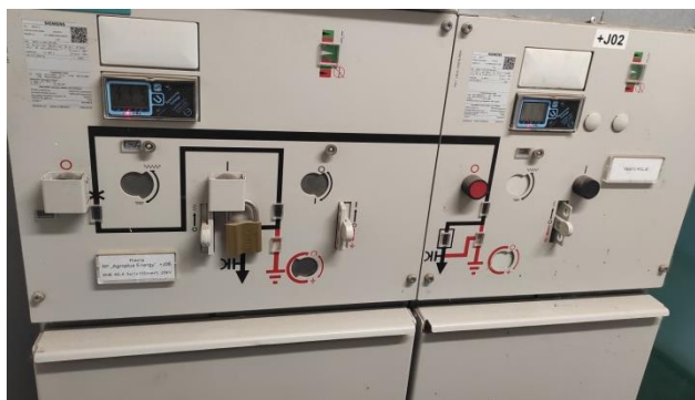
Slika 3. Spoljašnji izgled ormara prekidačke/transformatorske ćelije

U slučaju reagovanja bilo sistemske zaštite ili zaštite priključnog voda spojni prekidač vrši automatsko prekidanje paralelnog rada elektrane sa distributivnim sistemom električne energije. Orman rasklopne opreme sastoji se od prekidačkog i transformatorskog polja i dat je na slici 3.