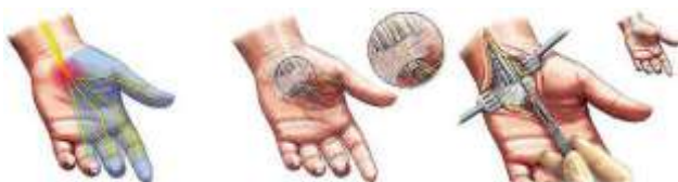
Slika 1: Karpalni tunel

Karpalni tunel- predstavlja nerastegljiv koštano-vezivni kanal, s prednje strane ograničen fibroznom trakom (retinakulum) kroz koji prolaze i potpuno ga ispunjavaju tetive devet mišića i medijalni živac koji inervise veći deo šake. I najmanje povećanje tkivne mase povećava pritisak u ovom prostoru i prouzrokuje kompresiju i ishemiju (nedovoljno snabdevanje krvlju) ovog živca, što se manifestuje karakterističnim simptomima. Lečenje je hiruško i izvodi se jednostavnim presecanjem retinakuluma [1].