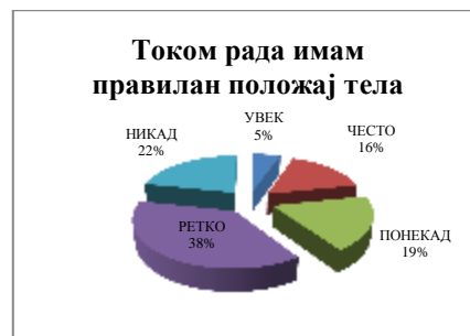
Slika 3: Odgovor na pitanje “Koliko često tokom rada imam pravilan položaj tela”

Poznato je da dugoročno sedenje za računarem u neprirodnoj poziciji može dovesti do oboljenja gornjih mišićno-skeletnih ekstremiteta. Prosečan odgovor ispitanih inženjera na pitanje o položaju tela u toku prikazan je na slici 2: