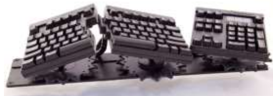
Slika 5: Ergonomska tastatura “ErgoFlex” [5]

Iako se pojmom “ergonomski” произвођачи управљачких уређаја (тастатура, мишева и играћких периферија) служе углавном у маркетиншке сврхе, постоји задовољјавајући број концепцијских разноврсних тастатура које су пројектоване тако да при дуготрајном раду узрокују минималан напор. Такве су специјалне тастатуре намењене корисницима с малим прстима (LittleFingers), дводелне и троделне тастатуре (Kinesis, GoldTouch, ErgoFlex) и оне с две групе тастера чије су осовине оријентисане под оштрим углом (Natural Keyboard, TypeMatrix). Нарочито су занимљиве ергономске тастатуре компаније SafeType, које, захваљујући вертикално полоиеним тастерима, у потпуности омогућују држање ручних зглобова у ортопедски неутралном положају. Велика разноврсност постоји и на тржишту ергономских мишева.