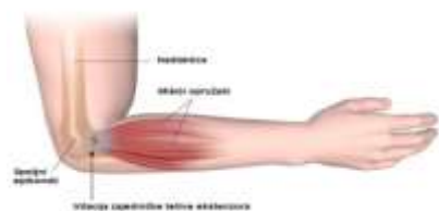
Slika 2: Lateralni epikondilitis (teniski lakat)

Lateralni epikondilitis (teniski lakat) - Lateralni epikondilitis ili, popularno nazvan „teniski lakat“, čest je uzrok bola u laktovima i rukama kod radnika koji rade za računarem. Softver inženjeri, nažalost, sve češće obolevaju od teniskog lakta. Bol koji se javlja u kostima na spoljašnjoj strani lakta. Ponekad se bol oseća i u mišićima podlaktice. Simptomi ove bolesti lako se otkrivaju rentgenom ili ultrazvukom [1].