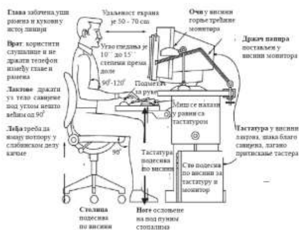
Slika 4: Preporučeno uređenje radnog mesta

На наредној фотографији приказано је правилно уређење радног места при раду на раћунару: