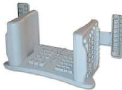
Slika 6: Izgled ergonomске “SafeType” tastature [5]