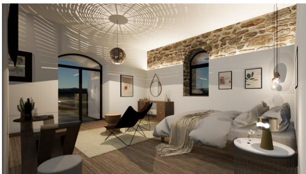
Илустрација 4: Визуелни 3Д приказ идејног решења студио апартмана

Целокупни простор тврђаве пројектом је предвиђен као место где се спајају комерцијални и културни садржаји. Предвиђен је као комплекс који је спој културних догађања и уживања у хотелским садржајима. Намера је била привући кориснике, промовишући културу и омогућавајући одрживи развој објекта, али и истичући амбијенталне, архитектонске и стилске вредности овог културног споменика.