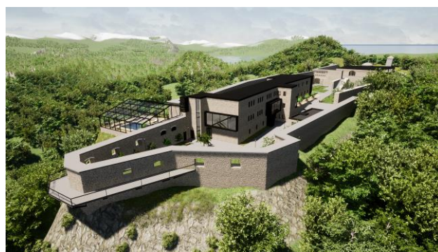
Илустрација 3: Визуелни 3Д приказ идејног решења екстеријера комплекса тврђаве

У оквиру идејног решења и овог рада објекти у тврђаве претрпели су измене које се највише огледају у новој просторној организацији, а све у циљу нове намене објекта који се тренутно не користи. Визуелна представа решења (екстеријера комплекса) приказана је илустрацијом број 3.