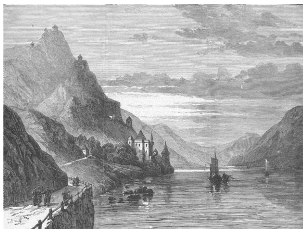
Илустрација 2: Стара илустрација Зворника са тврђавом из турског периода

Горњи град налази се на уздигнутом брду изнад града на преко 400 метара надморске висине. Дужина Доњег града од северне до јужне капије износи око 230 метара, а просечна ширина 30 метара. Налази се на надморској висини од око 140 метра надморске висине. Дужина Горњег града је 185 метара, а просечна ширина 35 метара, између бедема. Површина износи око 8000 m 2 [2].