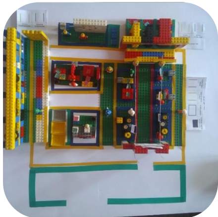
Slika 5 Ceo sistem

Izgled sistema nakon primene svih elemenata dat je na Slici 5.