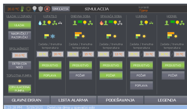
Slika 5: Izgled simulacionog ekrana

Vreme kada su roletne podignute unosi se preko panela. Izlaskom iz prostorije, posle određene vremenske zadržke, isključuje se svetlo, ventilacija, automatski se fan coil podešava da bude na željenoj temperaturi koju korisnik unese.