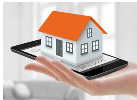
Slika 1: Pametna Kuća

Sistem omogućava realizaciju velikog broja međusobno povezanih funkcija, uključujući: kontrolu i regulisanje rasvete, kontrolu roletni, regulisanje grejanja, hlađenja i ventilacije, sigurnosne sisteme i monitoring, centralnu automatizaciju i sl. [1].