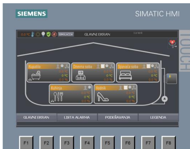
Slika 4: Izgled pametne kuće

Daljnom nadogradnjom softvera je moguće upotpuniti fazi upravljanje. Moglo bi se posmatrati više ulaza, npr. vremenska prognoza za narednih nekoliko dana, da li je neka prostorija na sunčanoj strani kuće, vremenski interval kada se kuva, koliko je ljudi u prostoriji itd. Na osnovu toga bi se upravljalo grejanjem i hlađenjem.