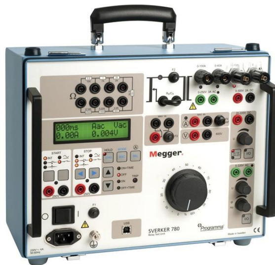
Slika 2. Izgled korišćenog kofera za ispitivanje zaštite pod oznakom Sverker 780

Uređaji za ispitivanje zaštite se nazivaju koferima za ispitivanje zaštite. Oni su namenjeni i za primarna i za sekundarna ispitivanja. Koferi „injektuju” struje u kolo i ako se radi o primernim vezama, ti koferi moraju biti velike snage usled velikih izlaznih struja. U ovom radu će biti korišćen kofer za sekundarno ispitivanje, međutim uz pravilno rukovanje, on može ispitivati i primarne veze. U radu je korišćen kofer pod oznakom Sverker 780 – slika 2.