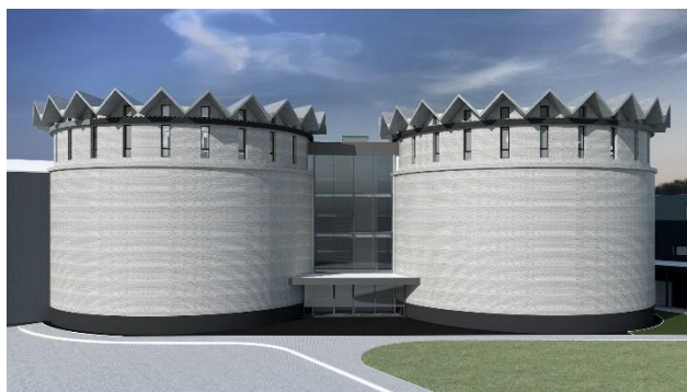
Slika 4 Izgled vinskih tornjeva nakon rekonstrukcije

Međutoranjski prostor (objekta "E") čine čelično stepenište, njegova glavna funkcija je u službi komunikacije. Idejnim rešenjem predviđeno je uklanjanje svih pomoćnih prostorija koje su se nalazile na međuprostoru. Predviđeno je formiranje lift okna na prostoru nekadašnjih pomoćnih prostorija kako bi se omogućilo nesmetano kretanje i pristup svim etažama osobama sa invaliditetom, deci i starijim osobama.