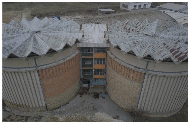
Slika 3 Postojeće stanje vinskih tornjeva kompleksa Podrum Palić

Svaki od dva tornjeva sastoji se od više etaža, Po+Pr+3. Konstrukcija tornjeva je od armiranog betona, napravljena od više cilindričnih AB ljuski, izdvojenih međuspratnim pločama. Krovna konstrukcija je polietarska AB ljuska prekrivena pocinkovanim limom. Međutoranjski prostor je naknadno izveden, predviđen je za vertikalnu komunikaciju i lakši pristup tornjevima. Konstrukcija je izvedena od hladno valjanih kutijastih čeličnih profila. Kao fasada i krovni pokrivač korišćene su dva profilisana bojena aluminijumska lima, popunjena poliuteranskom termoizolacijom.