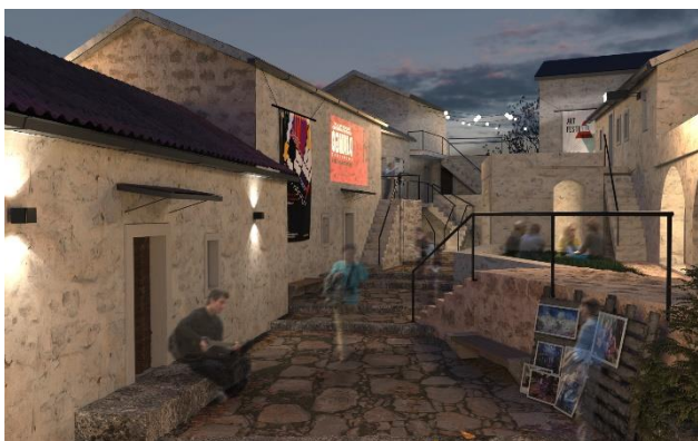
Слика 4. Приказ амбијента унутар насеља

Поред смјештајних јединица, читајући даље мрежу насеља, у старом језгру цјелине Лековић, предвиђени су културно јавни садржаји који би допринијели туристичким потенцијалима овог простора и омогућили пуно укључивање у савремене животне токове. Простор би обухватио културне садржаје попут: музеја, галерија, читаонице, библиотеке, књижаре, едукативних радионица на отвореном и затвореном.