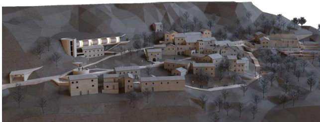
Слика 3. Тродимензионална визуализација амбијенталне цјелине Лековићи

Пошто традиционални објекти са својим скромним површинама не могу задовољити норму модерног туристичког објекта предвиђена је градња новог угоститељског објекта који би у свом садржају имао, паркинг простор, инфо пулт – рецепција, услуге припремања и услуживања хране, док би се у постојећим традиционалним објектима нудиле услуге смјештаја и различити културни садржаји.