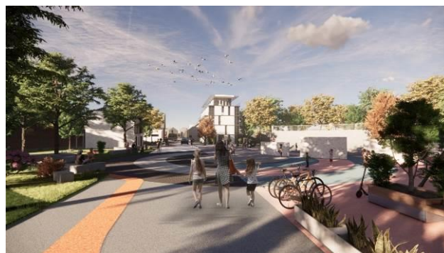
Slika 3. Prostorni prikaz drugog dela

Repernu tačku grada, koja se projektom uvodi u ovom delu ulice, predstavlja zona usporenog saobraćaja, odnosno deljena površina puta (230 metara dužine), koja se istovremeno koristi od strane pešaka, biciklista i motornih vozila, pri čemu pešaci imaju prednost i brzina vozila je ograničena na brzinu njihovog kretanja. Jedan deo ove zone zamišljen je kao prostor kružne forme, površine oko 1500 kvadratnih metara, sa različitim sadržajima (park, dečje igralište, skejt-park, teretana na otvorenom i slično), koji bi bili razgraničeni različitim materijalizacijom partera. Ovim, kao i uvođenjem nekolicine višeporičnih objekata, stvorila bi se prijatna porodična četvrt, koja svojom otvorenošću i prostorom za rasonodu i korišćenje slobodnog vremena, poziva u ovaj kraj žitelje čitavog grada.