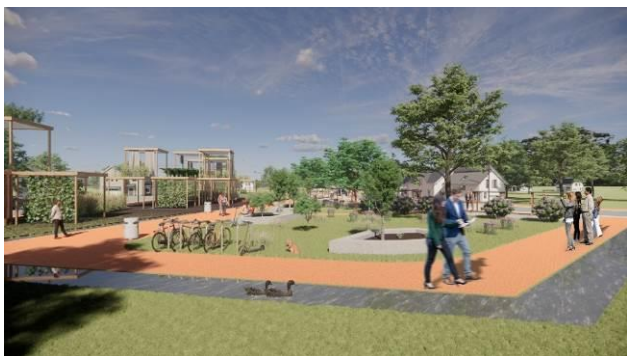
Slika 4. Prostorni prikaz trećeg dela

Glavni segment ovde predstavlja urbana bašta na oko 2500 kvadratnih metara, koja bi sadržala modularne elemente sa zasadima različitih biljaka na površini zemlje, ali i po vertikali. Pored bi bio park uz postojeći potok, a uz samu ulicu mesto sa štandovima na kojima bi se prodavali proizvodi uzgajani u bašti. Ovim bi početak periferije Kemnica postao jedna od repernih tačaka grada, uz podsticanje lokalne proizvodnje i ponude datih proizvoda na jednom mestu, čime bi i celokupno stanovništvo gravitiralo ka ovom delu, kako radi kupovine, tako i radi razonode i edukacije.