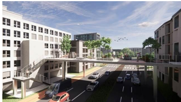
Slika 2. Prostorni prikaz prvog dela

Kemnica. Pored njega, izvršila bi se i prenamena nekadašnjeg hotela, a pre toga stambenog objekta na uglu Cvikauer ulice i Reichsstraße. Trenutno zapušten i prazan, ovaj objekat dobio bi drugačije obličje, doprinoseći novom identitetu i stvarajući specifično obeležje grada. To bi bio prostor koji bi lokalni umetnici koristili kao svoje radionice i galerije; jednom rečju – prvi gradski (sup)kulturni centar.