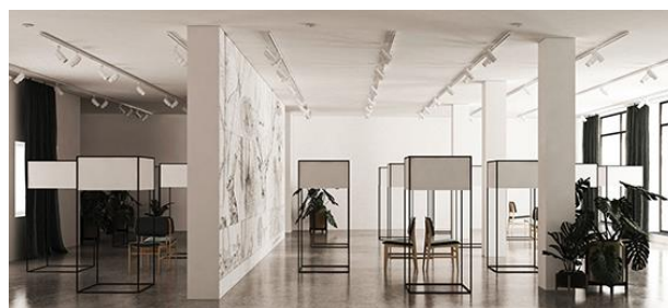
Slika 1. Prikaz na galerijski prostor

U galeriji se pojavljuje i ogroman zid, koji ima ulogu konstruktivnu. Isto tako može umetnicima služiti kao deo postavke, da li u vidu murala, tapete ili kao postavka okačena na zid, slika 1. Obrada zidova je ostavljena u beloj boji, nema nikakvih detalja na zidovima, da bi fokus korisnika prostora bila na izložbu. Obrada poda je glazirani beton, i predstavlja odličnu kombinaciju sa belom bojom. Što se tiče nameštaja, postavka za izložbu je promenljiva, i u zavisnosti od izložbe ona se postavlja ili sklanja. Tu su i stolice, koje uglavnom služe za odmor ili ako neko želi da sedi i da posmatra postavku, lako su pomerljive pa ih je lako i kontrolisati u prostoru.