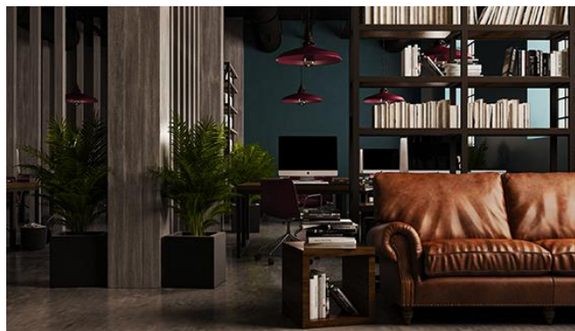
Slika 3. Prikaz coworking prostor

industrijskom stilu, autorsko delo. Dizajn radne stolice pripada studiju Lievore Altherr Molina.