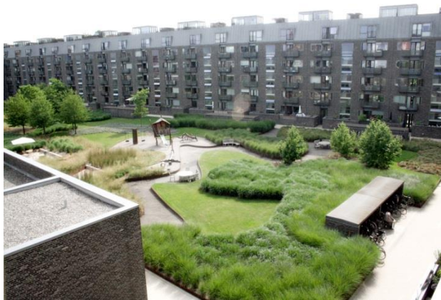
Slika 1. Primer uređenog unutarblokiovskog prostora

Tokom planiranja rešenja treba da budu zastupljene sve kategorije vegetacije – cveće, lišćari, četinari i šiblje, kao i vertikalno zelenilo. Drvenaste puzavice mogu znatno povećati estetski kvalitet fasada i ukupnu količinu zelenila, uz cveće na balkonima i terasama. Sadnja cvetnog šiblja je posebno pogodna jer doprinosi komforu čitavog prostora razbijajući sivilo urbanog gradskog jezgra. Travnate površine u ovakvim zatvorenim i osenčenim međublokiovskim prostorima treba da imaju visok stepen učešća.