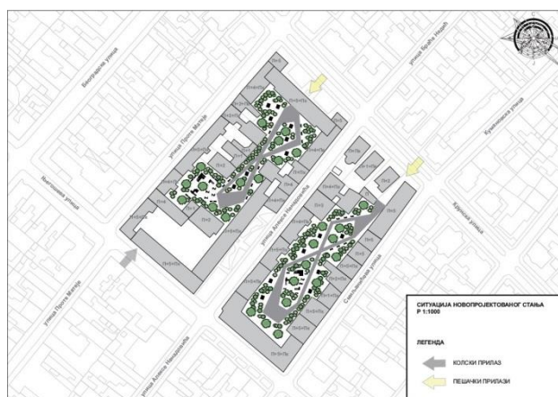
Slika 3. Situacija – predlog rešenja

Dvorišni mobilijar je od drveta i prati čitav koncept projekta. Savremeniji jednostavan dizajn i prirodne boje i materijali se uklapaju u celokupan prostor ne skrećući pažnju sa zelenila, istovremeno se uklapajući u prirodni ambijent. Klupe su raspoređene duž pešačkih staza i u većem broju su skoncentrisane kraj dečijih igrališta. Osim jednorodnih klupa postavljene su i grupe elemenata od po dve klupe sa stolom između njih. Pružaju prostor za okupljanje većeg broja korisnika, igranje društvenih igara ili malih porodičnih izleta.