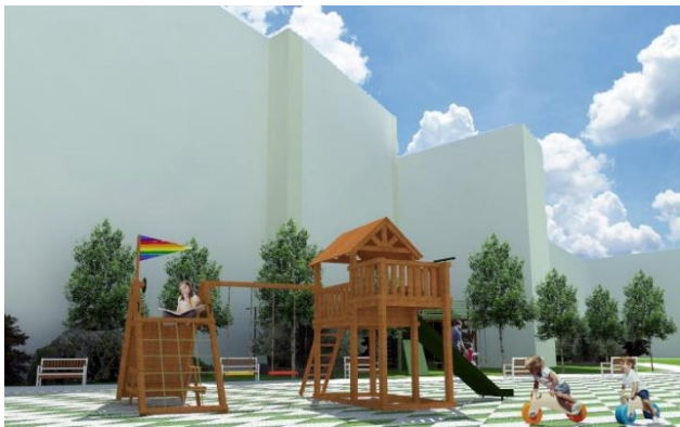
Slika 4. Trodimenzionalni prikaz novoprojektovanog prostora

Pored visokih stabala drveća, predviđena je visoka i niska žbunasta vegetacija. Na taj način biće postignuto diferenciranje prostora različite namene i promena dinamike u pejzažu. Zelene fasade neće u potpunosti biti zaklonjene od sunca, a vizure sa terasa okolnih objekata će biti bolje.