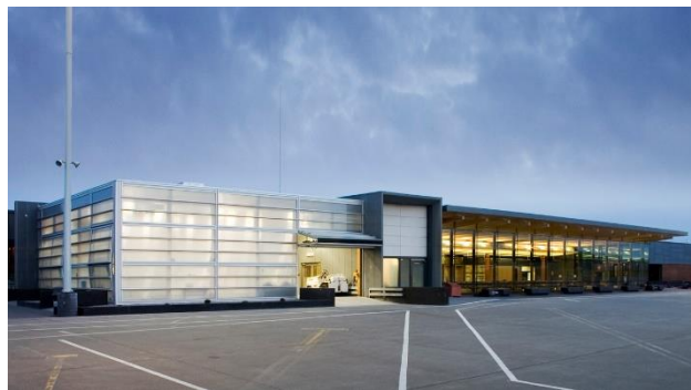
Slika 2. Putnički terminal aerodroma

Spoljašnje oblaganje podrazumeva inovativnu strukturalno zastakljenu zid-zavesu koja se oslanja na posebno dizajniranim limovima. Materijali koji su korišćeni su izabrani zbog njihove namene.