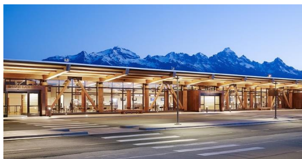
Slika 3. Putnički terminal aerodroma

Aerodrom „Jackson Hole“ je međunarodni aerodrom koji se nalazi 11km severno od grada Jackson. Ovaj aerodrom je jedini aerodrom u Sjedinjenim Američkim Državama koji je lociran u nacionalnom parku, u ovom slučaju „Grand Teton“.