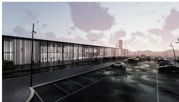
Slika 5 - zgrada putničkog terminala

Zbog velikih staklenih površina na fasadama su postavljeni brisoleji prikazani na slici 5. koji štite objekat od prekomernog osunčanja i zagrevanja unutrašnjeg prostora. U isto vreme ga čine i zanimljivim i ugodnim oku zbog rasporeda kojim su brisoleji poredani, stvarajući dinamičnu igru svetlosti i senke.