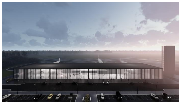
Slika 4-zgrada putničkog terminala

Pristanišna zgrada aerodroma Čenej je namenjena pružanju usluga prihvata i otpreme putnika i prtljaga kako u domaćem tako i u međunarodnom saobraćaju. Ideja vodilja bila je stvaranje prostora gde su jasno iskazane i definisane osnovne prostorno – programske celine, a opet sve povezane u jednu celinu.