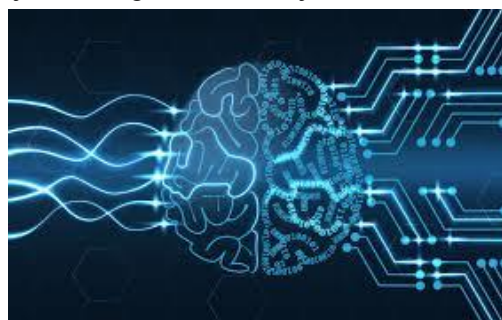
Slika 1. Vještačka inteligencija ilustracija

Zavidni rezultati neuronskih mreža u brojnim zadacima vještačke inteligencije, čiju ilustraciju vidimo na slici 1, pokazuju kako je to područje s izrazito velikim potencijalom. Nezavisno o tome radi li se o obradi i analizi slika, zvuka, video zapisa, teksta ili bilo kog drugog ulaznog podatka, neuronske mreže sve značajnije prednjače kao najbolji odabir algoritma za učenje.