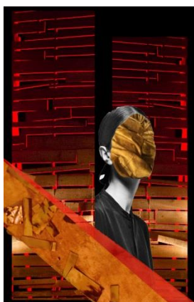
Slika 2 – Plakat pozivnica