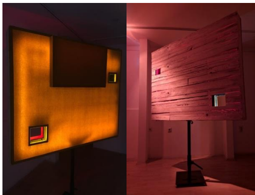
Slika 1 – postavka izložbe

Što smatram da je jako značajno za mene i svoj dalji rad. Time zaključujem svoje bavljenjem na temu proširene scenografije i smatram da sam u svojoj namjeri bar djelimično uspjela.