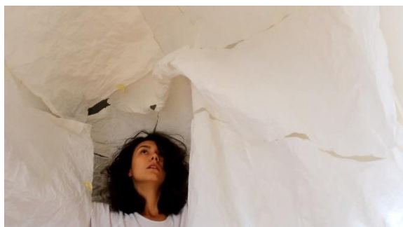
Slika 3. Isečak iz video dokumentacije izvođenja performansa, III deo