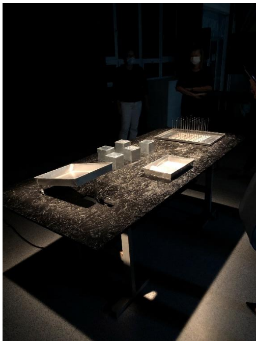
Slika 1 – postavka izložbe

Tek je poneki posetilac zavirio ispod stola da pogleda šta pokreće same mehanizme postavljene na stolu. Ono što je posebno bilo interesantno jeste to što su posetioci neprestano iščekivali da vide šta će se desiti sa mehanizmima i dokle će mehanizmi moći da rade.