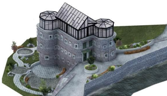
Slika 3. Rezultat revitalizacije

Kombinacija materijala koja je karakteristična za ovaj fortifikacioni objekat jeste kamen, čelik i čelični lim. Iako konstruktivni element, međuspratna konstrukcija sirova predstavlja zanimljiv element u enterijeru budućeg revitalizovanog objekta. Puškarnice su većinski razbacane po fasadnom platnu i različitih su dimenzija. U enterijeru, sva četiri čela šupljine u zidu su pod nagibom, dok je u eksterijeru samo donja površ zakošena. Na sredini otvora nalazi se štit od čeličnog lima sa procijepom za nišan. Prozori tvrđave, su kao i vrata, napravljeni od čelika. Ojačani su sa brojnim šarkama, vertikalnim i horizontalnim elementima i bravama, i ti elementi su povezani za bazične površine vezivnim elementima. Unutrašnja obrada zida je malter, koji je pretrpeo oštećenja od vlage i potrebno ga je sanirati. Kao dodatni spoljni elementi konstrukcije uvode se čelični nosači staklene konstrukcije koji kontrastno postojećem masivnom gabaritu formiraju poluprozirni reflektivni sloj. Za enterijer nove namjene objekta, karakteristični materijali su završna obrada pregradnih zidovakamena obluci, elementi za vazdušni komfor i neki elementi enterijera-bronza, podna obloga-WPC Decking, stepenice i neki elementi enterijera-palisander.