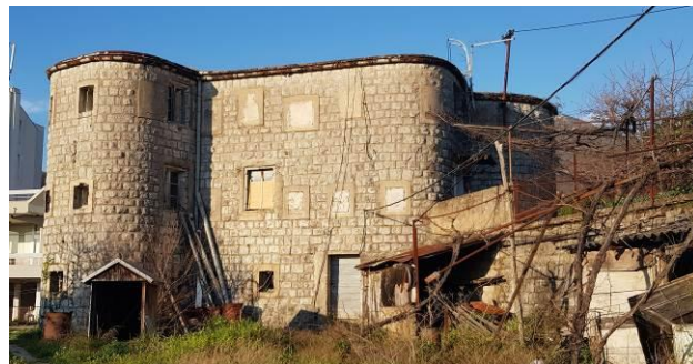
Slika 1. Zaprečno utvrđenje Zeljano – trenutno stanje

Utvrđenje Zeljano, izgrađeno 1907. godine, nalazi se uz potok Seljanovo na tridesetak metara od glavnog puta. Utvrđenje je urađeno kao kamena građevina koja ima tri etaže. Objekat se sastoji od nekoliko karakterističnih prostorija odnosno elemenata, a to su: ulaz (uvijek se nalazi na suprotnoj strani od očekivanog pravca napada), stražara (odmah pored ulaza), hodnik (povezuje prostorije), stepenište, cisterna, kuhinja, magacin (za municiju i hranu), sanitarni čvor, prostorija za smještaj posade, kaponiri (u obliku polukružnih kula). Zeljano je danas u relativno dobrom stanju, za razliku od ostalih građevina koje su štatile Arsenal. Bez obzira na svoju istoriju, ovaj objekat, kao i ostali objekti ovog zaštitnog niza do skoro nisu bila pod zaštitom države, odnosno nisu pripadala spisku kulturnih dobara države Crne Gore sve do 2018. godine kada je sa Austrijom potpisan Memorandum o očuvanju ovih utvrđenja.