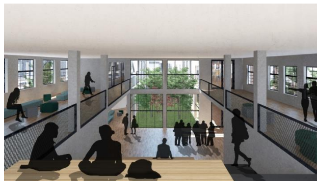
Слика 2. 3Д приказ амбијента уметничког центра