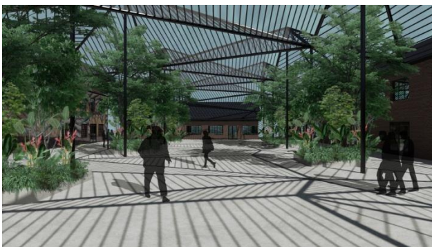
Слика 3. 3Д приказ амбијента унутрашњег дворишта

Успостављање јединственог, атрактивног и вишенаменог простора доприноси се квалитету, вредности и идентитету читавог комплекса који претендује да постане ново место културне и социјалне интеграције општине Инђије. (Слика 3.)