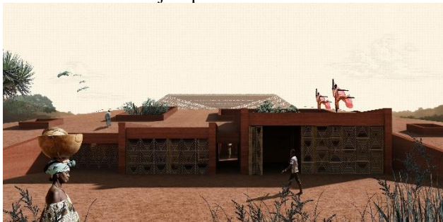
Slika 2. Prostorni prikaz druge celine

Prva celina predstavlja postojeći mikroambijent formiran objektima plesnog kolektiva koji radi na lokaciji. Postojeće vrednosti ove celine su očuvane i postojeće stanje objekata se zadržava. Ova celina predstavlja trem koji uvodi korisnika dublje u prostor.