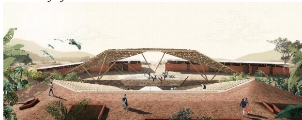
Slika 3. Prostorni prikaz treće celine

sagledava čitav prostor – amfiteatar u produžetku, ali i scena koja je deo treće celine.