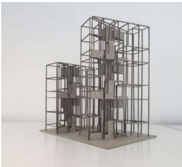
Slika 3. Maketa konstrukcije

Kolektivna kuća na Slaviji ne samo da je tačno odgovorila na zahteve sadašnjeg vremena nego je, čini se, odgovorila i na zahtev budućnosti. Vrlo lako ovaj prostor za nekih stotinu godina može biti nešto totalno drugo. Može beskonačno menjati namenu i funkciju, i svaki put će jednako pružati.