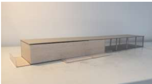
Slika 2. Konceptualna maketa povezivanja dve namene

Istraživanje ima zadatak da poveže dve različite namene u jednu. Predmet istraživanja je granica između stanovanja i poslovanja. Da li je moguće povezati ih i na koji način, kojim arhitektonskim elementima, i kako pri tome sačuvati funkciju svake ponaosob?