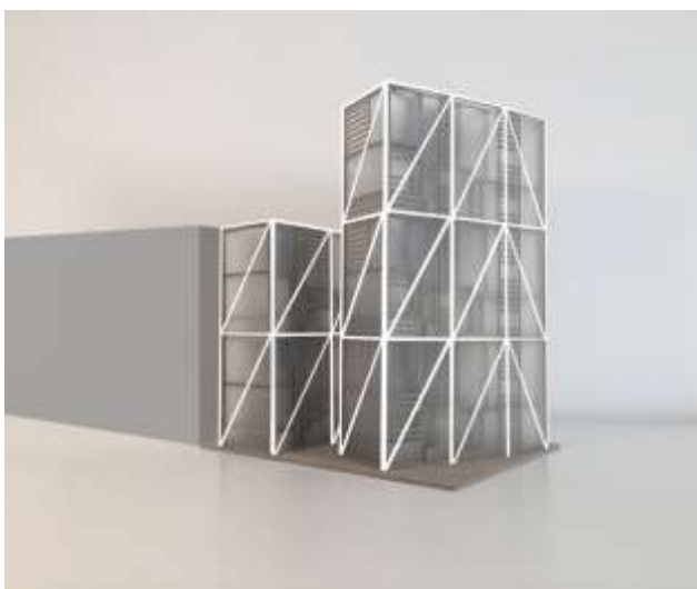
Slika 4. Maketa fasade