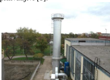
Slika 1. Toplovodni kotlovi 1, 2 i 3 sa zajedničkim emiterom [8]

Na slici 1 i 2 se mogu videti toplovodni kotlovi 1, 2 i 3 sa zajedničkim emiterom. Osnovni podatak jeste da je oblik emitera kružni, dimenzija Ø2 m, visine 16 m. Kotlovi poseduju dva priključka za uzorkovanje. Toplovodni kotlovi su zaštićeni zaštitnom ogradom od pada sa visine, što se može videti na slikama. Takođe, obilaskom mesta merenja utvrđeno je da su rizici za bezbednost opreme i zaposlenih prihvatljivi [8].