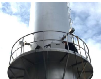
Slika 2. Toplovodni kotlovi 1, 2 i 3 sa zajedničkim emiterom [8]

Na slici 3. može se videti emiter toplovodnog kotla 6. Osnovni podatak jeste da je oblik emitera kružni, dimenzije Ø1,4 m, visine 20 m. Toplovodni kotao poseduje dva merna priključka za uzorkovanje. Toplovodni kotao zaštićen je zaštitnom ogradom od pada sa visine, što se može videti na slici. Takođe, obilaskom mesta merenja utvrđeno je da su rizici za bezbednost opreme i zaposlenih prihvatljivi [8].