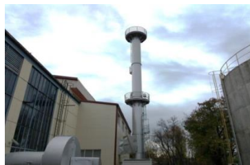
Slika 3. Emiter toplovodnog kotla 6 [8]

Toplovodni kotlovi 1, 2 i 3 sa zajedničkim emiterom jesu postojeće srednje postrojenje za sagorevanje, dok je emiter toplovodnog kotla 6 postojeće veliko postrojenje za sagorevanje.