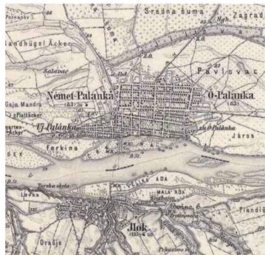
Slika 1 – Bačka Palanka i Ilok, 1887. godina

Devetnaesti vek je veoma bogat događajima koji su bitno uticali na razvoj grada, poput ponovnog davanja statusa varošice selu Bačka Palanka. Od tada kreće kulturni i industrijski razvoj grada, ali i teritorijalni u vidu definisanja Nemačke, Nove i Stare Palanke, što je prikazano na slici 1. Pored mnogobrojnih hotela i gostionica koje se otvaraju, naselje dobija i Poresku upravu, Lokalni sud, banke, sefove i jednu od najznačajnijih fabrika do danas – „Juta“ (današnji „Sintelon“) [1]. Na kulturnom planu, krucijalnu ulogu odigrala su otvaranja Građanske i Šegrtske škole, kao i Srpske čitaonice.