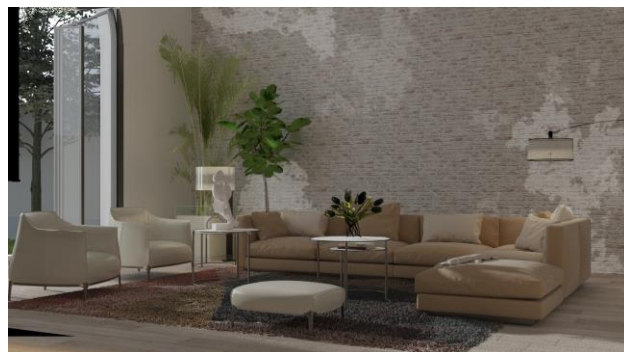
Slika 4 – deo enterijera objekta

uvođenje novih prozora i vrata, postavljanja odgovarajuće termoizolacije i hidroizolacije.