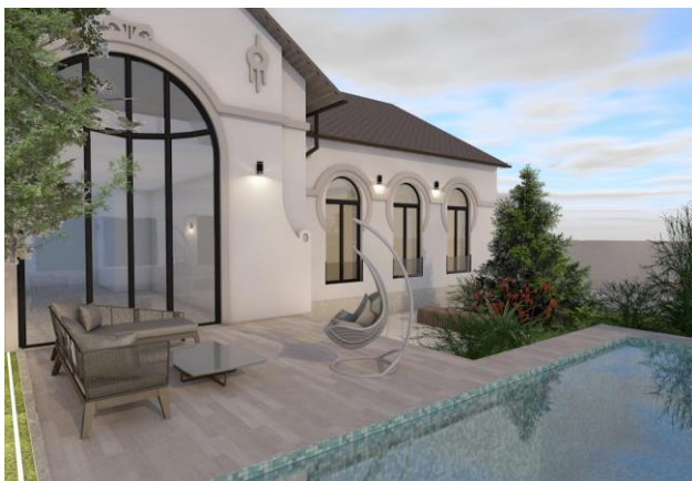
Slika 3 – eksterijer objekta i dvorište

Postoji težnja korespondiranja objekta sa prirodnim elementima, kao što se može videti na slici 3. Zasađeno bilje i organizacija funkcionalnih zona u objekta odgovara prirodnim faktorima koji vladaju u gradu i u cilju su što efikasnije zaštite objekta od spoljašnjih uticaja.