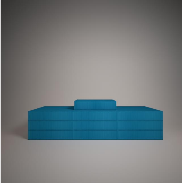
Slika 2. Fasada kontejnera.