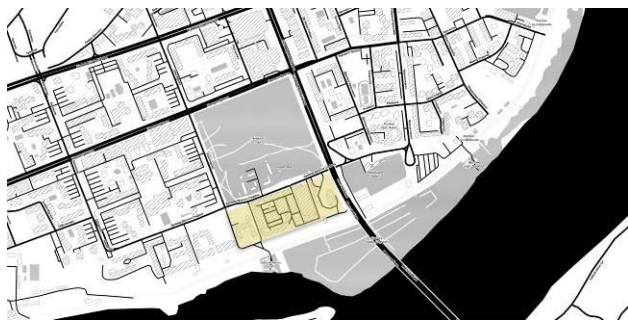
Slika 1. Šira situacija – Kineska četvrt

Zbog same pozicije Kineske četvrti, i neposredne blizine gradskog šetališta i parka, kao i zvučna izolovanost od stambene zone, Kineska četvrt je čvorište gde dnevno cirkuliše veći broj ljudi. Tu ubrajamo i posetioce koji ciljano dolaze do Kineske četvrti ali i slučajne prolaznike koji su se uputili ka parku ili gradskom šetalištu (Sl. 1).