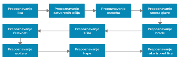
Slika 1. Koraci kreiranja skupa podataka

Koraci generisanja skupa podataka se mogu videti na slici 1. Prvo je detektovano lice na slici pomoću kombinacije Histogram of Oriented Gradients (HOG) obeležja i SVM ( Support Vector Machine ) modela [6]. Nakon toga su filtrirane slike gde oči nisu otvorene. Nakon toga sledi detekcija: osmeha, smera glave, šiški, brade, ćelavosti, naočara, kape i ruke ispred lica. Za svaku od navedenih osobina su detektovane slike iz filtriranog skupa. Nakon što su za datu osobu pronađene 3 slike po gore navedenim kriterijumima, potraga za slikama ove osobe se završava.