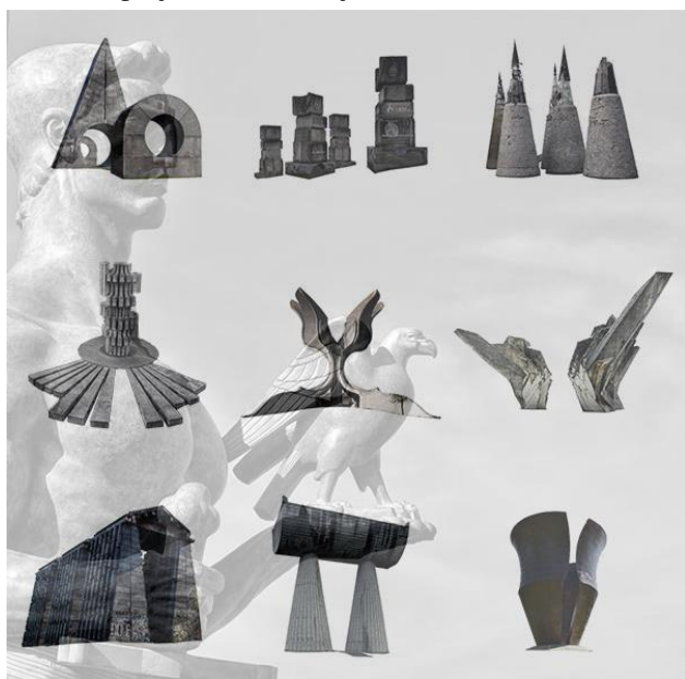
Slika 1. Spomenici

Na slici 1 su predstavljene forme spomenika koji su uticali na projekat stambene jedinice.