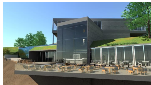
Slika 3. Restoranski deo sa terasom iznad litice

Pristup parceli je omogućen na dva ulaza, od kojih je jedan za goste gde na samom ulazu se nalazi parking i portirnica, odakle se gosti prevoze električnim vozilima do glavnog objekta. Recepcija je strateški locirana u prizemlju, tako da se njoj može pristupiti sa svih ulaza u glavni objekat. Odatle se gosti prvi put susreću sa glavnom atrakcijom ove lokacije – pogledom na Dunav i Banat prekoputa. Sa ove tačke je omogućen pristup spratu gde se nalaze kancelarija i konferencijska sala kapaciteta za 100 osoba, podrumu sa restoranom, kao i spa centru i apartmanima. Sav javni sadržaj je pozicioniran i orijentisan tako da se pruža pogled sa vrha litice. Restoran u podrumu je proširen pomoću terase koja konzolno stoji iznad litice i spuštenu je 75cm u odnosu na nivo restorana kako ne bi ometala pogled gostima unutar restorana (slika 3). Spa centar obuhvata masaže, saune, dakuzije, ali i zatvoreni i otvoreni bazen.