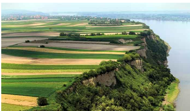
Slika 1. Litica u Surduku

Proučavanjem turizma u Vojvodini, tačnije u Bačkoj i Sremu, dolazi se do zaključka da je on slabo razvijen na ovim prostorima. Ponuda je veoma mala, ali sa druge strane je većinski kvalitetna. Osim većih gradova kao glavne atrakcije za turiste, dosta su popularna i etno sela i salaši kao autohtona obeležja ravnice. Kreiranjem drugačijeg sadržaja koji će se izdvojiti svojom ponudom, ali i autentičnošću od trenutne ponude, neophodno je bilo pronaći parcelu koja pruža niz mogućnosti za stvaranje hotelskog kompleksa koji je nekonvencionalan za ove krajeve. Neobična topografija terena kraj Dunava u Surduku lociranom na oko 50km od Novog Sada i 60km od Beograda, koja sadrži liticu u visini od 40m (prikazana na slici 1.) daje dobru podlogu za izgradnju komercijalnih sadržaja koji bi iskoristili ovaj prirodni fenomen.