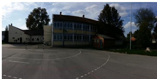
Slika 4. Dvorišna fasada objekta

Objekat osnovne škole se sastoji iz dva, konstruktivno nezavisna, objekta, starog i novog dela, koji zajedno čine jednu funkcionalnu celinu. Stari deo škole P+0, koji se nalazi uz ulicu je izgrađen 1900-te godine. Godine 1980. sagrađen je noviji deo škole, P+1 u dvorišnom delu parcele, a projektovan 1978. godine.