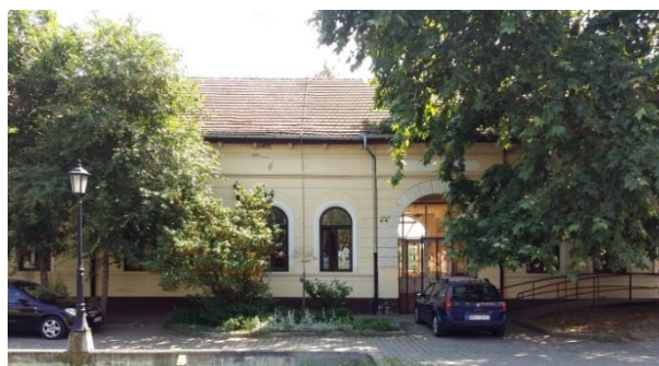
Slika 3. Ulična fasada objekta

Zgrada osnovne škole „Žarko Zrenjanin - Uča“ je locirana u naselju Nadalj, u ulici Svetog Save br. 31, k.p. 895 k.o. Nadalj (Slike 3 i 4). Ukupna bruto površina katastarske parcele 895 k.o. Nadalj je 5.282,00 m 2 . Površina zemljišta pod zgradom ili drugim objektom je 1.112,00 m 2 , a površina zemljišta uz zgradu je 500,00 m 2 .