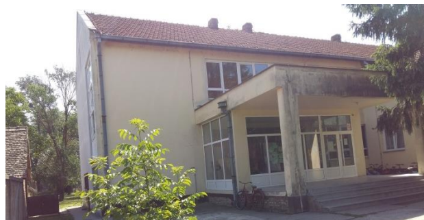
Slika 5. Biološka korozija na fasadi

površinskih delova zgrade, ljuškanje, pukotine i prsline, raslojavanje i mrlje na fasadnim zidovima objekta. U unutrašnjosti objekta, pojavljuje se ljuškanje, bubrenje i odvajanje završne obrade zidova i plafona kao posledica prisutnosti vlage u samom objektu. Takođe, pojava prsline kao posledica skupljanja usled sušenja pojedinih betonskih elemenata konstrukcije.