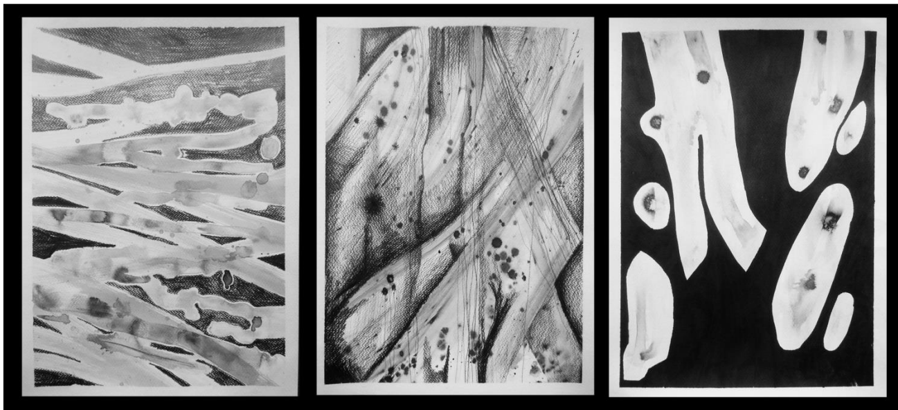
Slika 1. Kolaž crteža iz procesa rada

sa okolinom i koliko se poistovećujemo sa njom. Treću funkciju čini introvertno razmišljanje (Ti) i ono predstavlja naš unutrašnji logički sistem. Četvrtu funkciju čini ekstrovertno opažanje/percepcija (Se) i ona predstavlja naš doživljaj fizičkog sveta onakav kakav jeste, u realnom vremenu i prostoru.