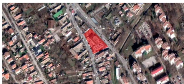
Slika 1. Uža situacija

S obzirom da se Petrovaradin nalazi na Sremskoj strane Vojvodine, gde je najzastupljenija grana privrede poljoprivreda i stočarstvo. Proces proizvodnje prati prodaja samog proizvoda, a prostori gde se ona vrši u NS su loši, zapušteni, zastareli, zabačeni, i u senci od velikih supermarketa.