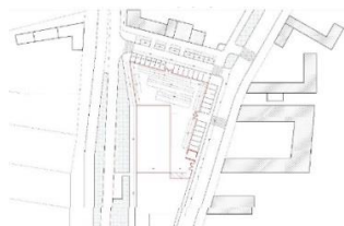
Slika 2. Petrovaradinska pijaca – postojeće stanje