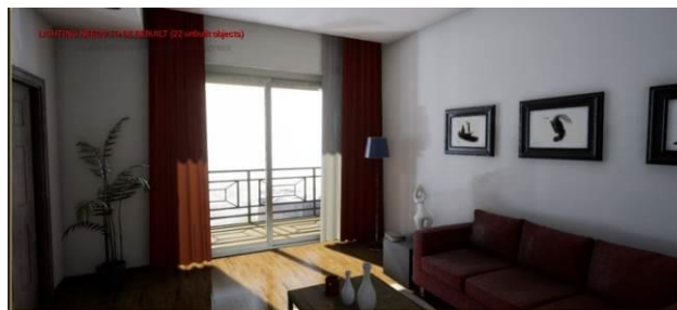
Slika 4. Prikaz scene – „Jutarnji ambijent“

Za kreiranje muzike bilo je potrebno napraviti Sound klase za svaki zvuk, kao i po dva Sound Mix -a. Jedan Sound Mix predstavlja zvuk koji je skroz utišan, dok drugi služi za njegovo ponovno puštanje. Takođe, u programiranju je važno voditi računa da se obezbede svi slučajevi koje korisnik može da izabere. To je postignuto dodavanjem funkcija Gate i Flip/Flop .