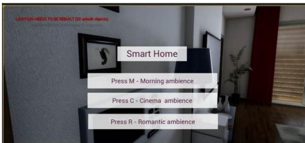
Slika 8. Korisnički interfejs za odabir scenarija

Osim ovog, kreiran je još jedan korisnički interfejs, koji služi za informisanje korisnika kako da odabere neki od scenarija.