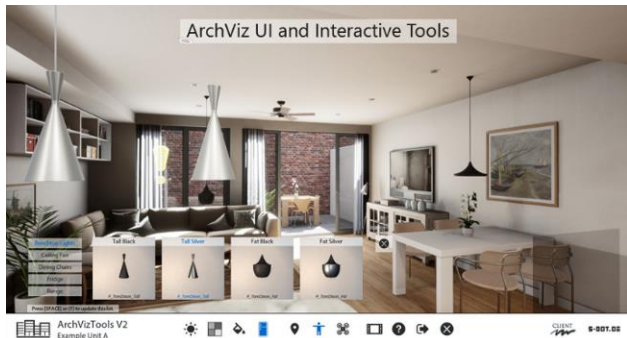
Slika 1. Primer interaktivne arhitektonske vizualizacije

Iz tog razloga u ovom radu je napravljeno istraživanje kako kreirati takvu vizualizaciju u programu Unreal Engine , koji pruža mogućnost real time interakcije i promenu stanja scene samo jednim klikom.