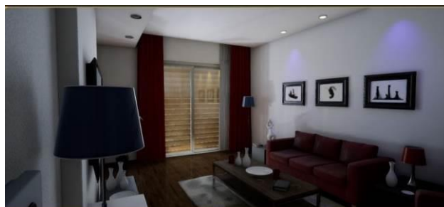
Slika 5. Prikaz scene – „Ambijent bioskop“

Kada su podešena svetla i animacija, naredni korak jeste dodavanje video teksture i puštanje filma na TV-u. Ovaj postupak podrazumevao je kreiranje novog File Media Source -a koji je u stvari video koji želimo da pustimo. Nakon toga bilo je potrebno kreirati i jedan novi Media Player koji zatim kreira i teksturu sa dodeljenim video sadržajem. Na sledećim slikama prikazan je izgled scenarija: „Ambijent bioskop“.