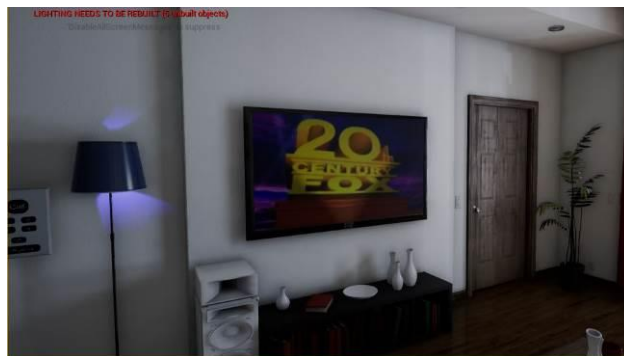
Slika 6. Prikaz scene – „Ambijent bioskop“