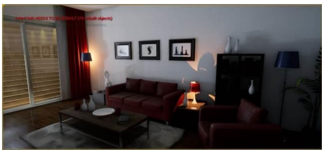
Slika 7. Prikaz scene – „Romantični ambijent“

Izgled scenarija koji predstavlja romantični ambijent, prikazan je na sledećoj slici.