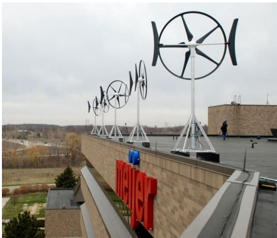
Slika 5. Swift Wind turbina [2]

Proizvođač tvrdi da je skoro nečujna. Pravi se od polimera armiranim nano vlaknima.