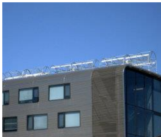
Slika 3. Spiralna Aerotecture turbina na zgradi u Čikagu [2]

Ovaj tip turbina je visine 3m i 1,5 m u prečniku, 510 V, dizajnirana je za vertikalno instaliranje sa predviđenim izlazom od 1 kW na vetru od 14 m/s. Polazna brzina na kojoj turbina počinje da proizvodi energiju je 2,8 m/s.