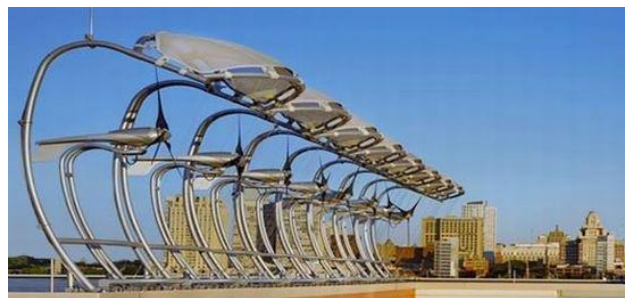
Slika 2. Aero vironment AVX1000 [2]

Ova kompanija je lider u tehnologiji integrisanih turbina. Godine 2006., kompanija je predstavila turbinu od 400W dizajniranu da iskorišćava vetar na atikama objekta. Turbine su dizajnirane da se postavljaju u nizu, npr. 20 komada na zgradi.