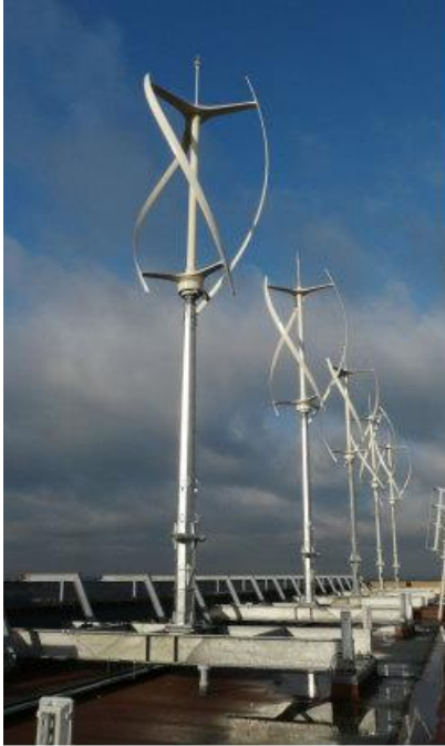
Slika 4. Quiet Revolution turbine [2]

Visoka je 5 m (bez nosećeg stuba), sa 3,1 m u prečniku turbina može stajati na nezavisnom stubu ili na krovu zgrade.