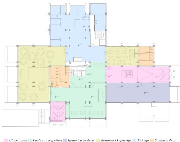
Slika 3. Predlog rešenja prizemlja

Prizemlje je etaža koja je najvažnija za hotel jer se prvo preko nje gost upoznaje sa prostorom hotela i prvenstveno nju koristi kao javni sadržaj. Veoma je važna pažljiva organizacija ove etaže, uz uvažavanje pristupa i linija kretanja unutar nje, kao i daljem kretanju na više etaže.