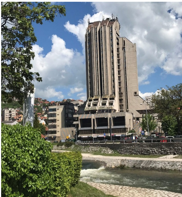
Slika 2. Hotel Zlatibor danas

Hotel je lociran u jugozapadnom delu Trga partizana između ulica Dimitrija Tucovića, Malog trga, Omladinske i Strahinjića Bana zahvatajući praktično celokupan blok. Lokacija je definisana tokom izrade projekta Trga partizana 1958. godine [2].