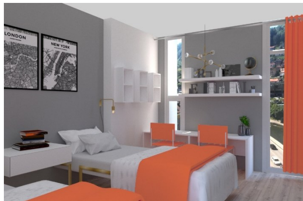
Slika 4. Predlog rešenja studentske sobe

Pošto je izgrađen u betonu, spoljašnji izgled je zadržan u potpunosti, osim stolarije koja je predviđena kao savremeni, energetske efikasan sistem. Predviđene staklene površine sadrže fotonaponske ćelije, radi prikupljanja sunčeve energije. Enterijer objekta dobio je novi, savremeni izraz. U enterijeru ulaznog dela i recepcije predviđeno je zadržavanje postojećih kamenih ploča podne obloge, kanelura na betonskim površinama zidova i stubova, dok se nova recepcija projektuje u materijalu u kojoj je izvedena i prvobitna – drvenoj oblozi.