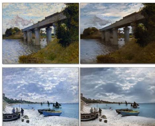
Slika 9. Primeri transformacije slike u fotografiju [8]

S obzirom na to da impresionistički period ima jedan od najspecifičnijih stilova slikanja, viđenja prirode i prelamanja svetlosti na materiji, tehnologija se najviše fokusirala da omogući digitalno pretvaranje fotografija u impresionističko delo. Međutim nedavno su istraživači iz UC Berkley uspeli da naprave algoritme koji rade suprotno, naime Moneovu sliku pretvaraju u realističnu fotografiju. Mogućnost pretvaranja slike u nešto što izgleda kao prava fotografija može ponuditi izvanredan uvid. Posmatrač će dobiti ideju o tome šta je umetnik stvarno video kada je stvorio delo. Pejzažni fotografi će moći da vide kako je možda svetlost padala na lokaciju (slika 9.).