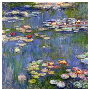
Slika 3. Lokvanji, 1916. [3]