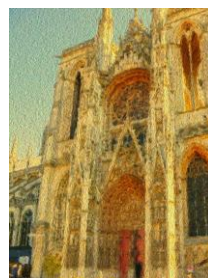
Slika 6. krajnji rezultat