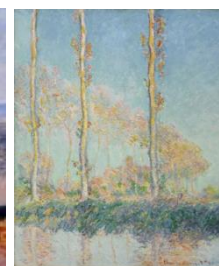
Slika 2. Topole 1890. [2]