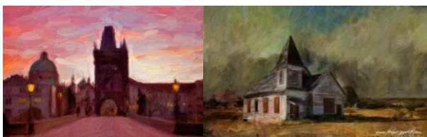
Slika 8. Primeri transformacije fotografija primenom SNAPart aplikacije [7]

Neke od ponuđenih filtera su ulje na platnu, skica olovke, kreon, akvarel itd. Moguće je koristiti masku sa detaljima SnapArt-a da bi se ubrzale i poboljšale pojedinačne nijanse određenih oblasti na fotografiji. Aplikacija nudi čuvanje novostvorenog izgleda sa unapred podešenim imenom, kategorijom i čak uključuje beleške. Kasnije je moguća primena svega toga na fotografiju (ili seriju fotografija) jednim klikom. Unapred podešeni pretraživač koristi sličice za vizuelno lakši odabir filtera koji se nalazi po kategorijama poput „Impasto“, „Crayon“ ili „Watercolor“. U Snap Art-u moguće je označiti omiljeni filter radi olakšanja kasnijeg odabira, a poslednji primenjeni efekti se automatski pamte.