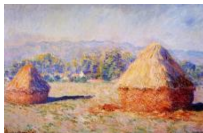
Slika 1. Sena na suncu, jutarnji efekat 1890. [1]

Izbor palete, ugao slikanja, subjektivni doživljaj motiva i drugi faktori su ovde akcentirani analize.