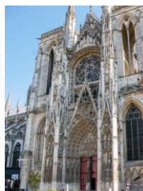
Slika 5. Ruanska katedrala [5]

Krajnje rešenje prikazano je na slici 6.