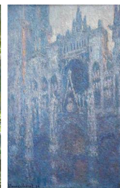
Slika 4. Ruanska katedrala, vedar dan 1894. [4]

Ciklus slika koje je Klod Mone posvetio stogovima sena predstavlja prvi svesno načinjen korak ka poništavanju teme u korist izučavanja subjektivnih opažaja i viđenja uslovljenog atmosferom.