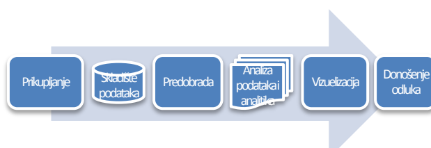
Slika 3.1. – Tok obrade podataka

Glavni cilj upotrebe analize velikih podataka je izvlačenje korisnih informacija (vrednosti) iz podataka. Ova vrednost se može izvući iz prikupljenih podataka nakon obavljanja analitike na podacima kao što je prikazano na slici 3.1. [3] Preduzeća i potrošači mogu donositi odluke na osnovu dobijene vrednosti.