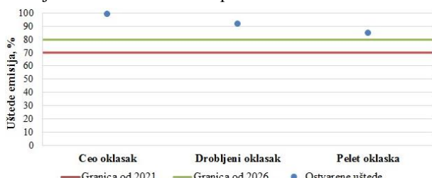
Grafik 3. Ostvarene uštede emisija GHG

Na grafiku 3 prikazane su ostvarene uštede u emisijama i kriterijume za održivost. Sva tri scenarija ispunjavaju kriterijume održivosti za oba perioda.