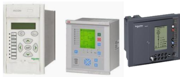
Slika 2.1. Izgled današnjih mikroprocesorskih zaštita različitih proizvođača

Mikroprocesorski releji jesu savremena vrsta zaštitnih releja koja se sve češće primjenjuje danas. Krajem šezdesetih godina su se počeli razvijati mikroprocesorski zaštitni sistemi. Kao što je i logično pretpostaviti jeste da je tada mikroelektronika bila veoma skupa pa je bilo veoma nepraktično raditi sa ovakvom zaštitom koja pri tom nije imala veliku pouzdanost. Kako je vrijeme prolazilo, uređaji elektronike bivali sve jeftiniji, a način izrade mikroprocesora obezbjeđivao sve veću pouzdanost, tako se sve više išlo ka tome da se njihova primjena u relejnoj zaštiti poveća. Danas se sve češće vide ovakvi uređaji, kojima se zamjenjuju stari (mehanički i elektromagnetni) releji. Stari releji se nastavljaju primjenjivati dokle god mogu da ispune tražene zahtjeve, odnosno, dokle god je to isplativo. S obzirom na borbu za tržištem, proizvođači se konstantno nadmeću tako što iznova dodaju nove mogućnosti ovih releja, proizvode softverske alate za lakšu upotrebu i sl. Na slici 2.1 prikazan je izgled tri mikroprocesorska releja različitih proizvođača [3].