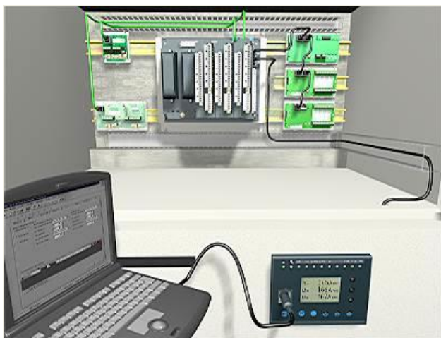
Slika 3.3. Parametrisanje zaštitnog releja

Za proračune parametara u stacionarnim stanjima kod asinhronih motora je moguće koristiti standardnu ekvivalentnu šemu motora koja služi za proračune karakterističnih veličina motora, na osnovu kojih mogu biti određeni parametri zaštite motora. Podešavanje tih proračunatih parametara za svaku od navedenih zaštita vrši se u odgovarajućem softveru u zavisno od korišćenog uređaja, prikazano kao primjer na slici 3.3. Softver „SFT2841“ služi za parametrisanje zaštitnih funkcija za uređaj tipa „Sepam“. Karakteristike ovakvog programa su lako lak rad i intuitivnost [5].