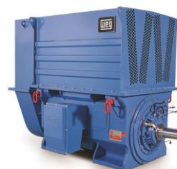
Slika 3.1. Visokonaponski asinhroni kavezni motor proizvođača WEG

Na slici 3.1. se može vidjeti asinhrona kavezna mašina specijalne izvedbe, koja se koristi u pumpama visokog pritiska. U pitanju je šestopolni asinhroni motor ukupne snage 1203 kW, na naponskom nivou od 13,8kV i 60Hz, IP 56 zaštite [2].