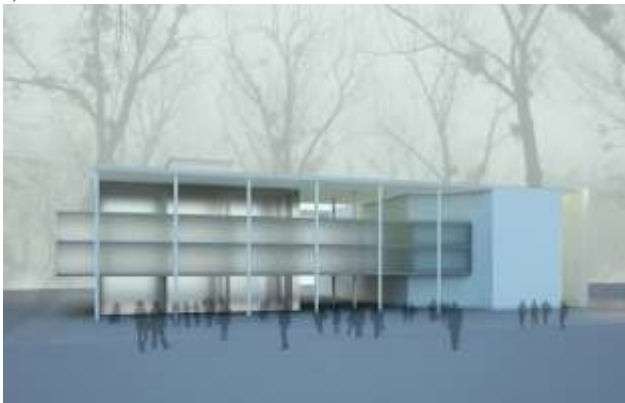
Slika 1. Trodimenzionalni prikaz objekta

Oblikovni princip se zasniva na poštovanju konteksta, kako prirodnog tako i izgrađenog. U tom smislu, posvećena je pažnja uklapanju u postojeći kontekst zelenila. Iskorišćena je pogodnost postavke objekta na jednom takvom neizgrađenom prostoru, radi otvaranja kvalitetnih vizura. Što se tiče odnosa sa izgrađenom sredinom, izabrana je kompaktna forma objekta koja se uklapa u postojeće okruženje kampusa, pre svega sa objektom rektorata koji je izrazito kubične forme (Slika 1).