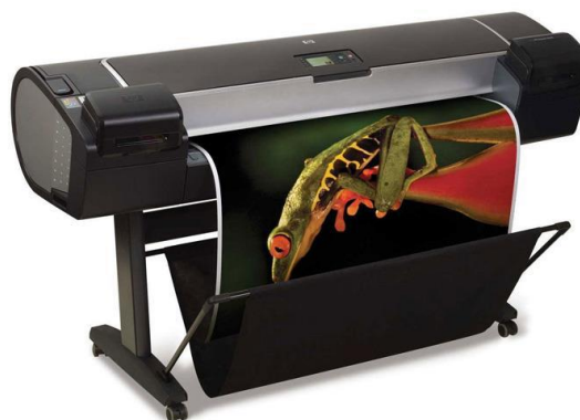
Slika 2. Grafički sistem HP Z5200 [2]

Hrapavost je merena uređajem TR200 [3], dok je za merenje optičkih osobina papira korišćen Eye-One spektrofotometar [4].