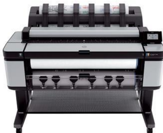
Slika 1. HP T3500 [1]

U eksperimentalnom delu radu, kao grafički sistemi korišćeni su uređaji HP DesignJet T3500 (slika 1.) i HP DesignJet Z5200 (slika 2.)