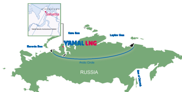
Slika 1. Geografski položaj na karti

Pored tri fabrike za proizvodnju LNG-a, na samoj lokaciji nalazi se još veliki broj postrojenja, i privremenih objekata koji omogućavaju da se proces proizvodnje LNG-a, kao i život na tako udaljenom i izolovanom mestu odvija nesmetano.