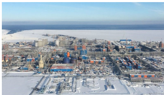
Slika 2. Pogled iz ptičije perspektive