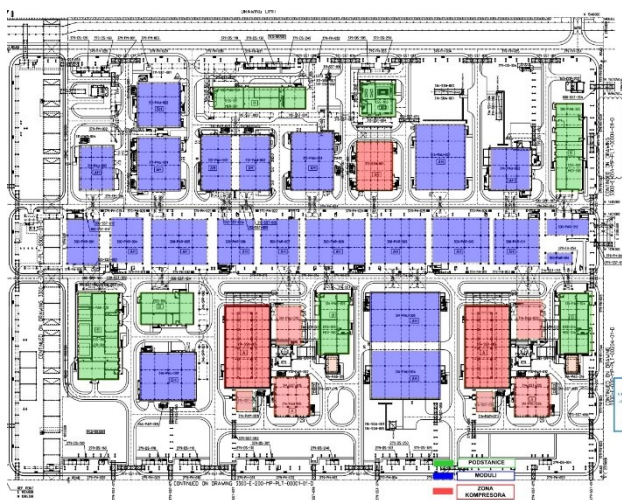
Slika 3. Osnova fabrike