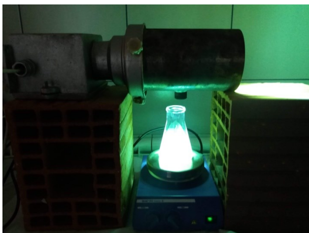
Slika 3. Uređaj za UV zračenje

HPLC metoda za analizu degradacije ibuprofena se sastojala od dve mobilne faze: 50% - 0,1% sirćetne kiseline u ultračistoj vodi i 50% acetonitrila. Razdvajanje je bilo izokrasko, i retenciono vreme ibuprofena iznosilo je 11 minuta ( r_t=11 min). Talasna dužina koja je podešena za ibuprofen je bila 220 nm, a protok mobilnih faza iznosio je 0,8 mL/min.