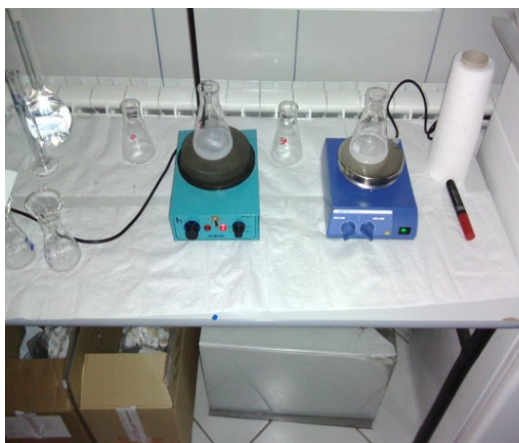
Slika 2. Magnetna mešalica

HPLC metoda za analizu degradacije ibuprofena se sastojala od dve mobilne faze: 50% - 0,1% sirćetne kiseline u ultračistoj vodi i 50% acetonitrila. Razdvajanje je bilo izokrasko, i retenciono vreme ibuprofena iznosilo je 11 minuta ( r_t=11 min). Talasna dužina koja je podešena za ibuprofen je bila 220 nm, a protok mobilnih faza iznosio je 0,8 mL/min.